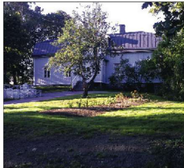
Kulttuuria kesään. Keravalla Kaskekan kupessa sijaitseva upea Humblebergin eli Keravan kartano avaa kesäkuussa kulttuurille.