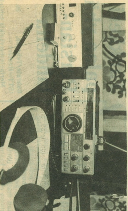
Radioamatöörin laitteilla koko maailma on tarjottimella.

Radioamatöörit ovat jakaneet maailman totutusta poikkeavasti. "Maitä" on kolminensataa. Mm. Ahvenanmaa on omata maanaan. Korttien lisäksi kerätään maitä, Albania ja Vatikaani ovat haluttumpia, koska harrastajia on vähän.